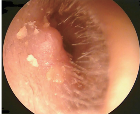
Fig. 1. Otoscopic view of tubular adenoma. The left external auditory canal is partially obstructed by the tumor.

원주형 모양의 근상피세포를 가지고 있었다. 고배율에서 관찰했을 때 비록 원주세포의 관상 내에 단두양 분비(decapitation secretion)는 없지만 세포 부스러기와 호산성 과립물이 존재하며 일부는 아포크린으로 분화되는 특성이 있었다(Fig. 2). 면역형광염색법상 p63에서 외측의 근상피세포에서 양성 반응을 보이고 세포이형 및 말초 근상피세포가 작게 관찰되는 것으로 관상 아포크린 선종, 관상선암과 구별하였다(Fig. 3). 술 후 4개월째 환자는 경과 관찰 중이며 재발 소견은 보이지 않고 있다.